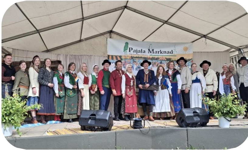
Draktvisning under Kväänifästi i Pajala.